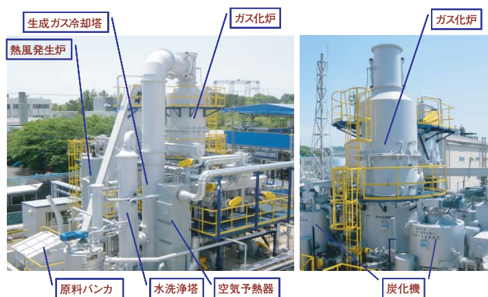
バイオマス/廃棄物炭化ガス化炉