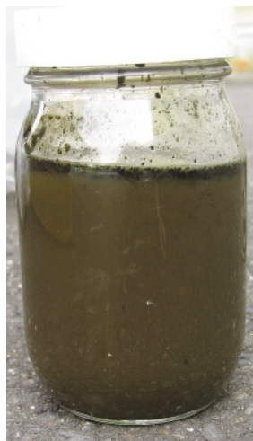
写真2（上）分離された含水DME

つまり、圧縮機などに必要な最低限のエネルギーだけで稼動する、極めて効率の高い省エネルギーシステムを構築できる可能性があります。