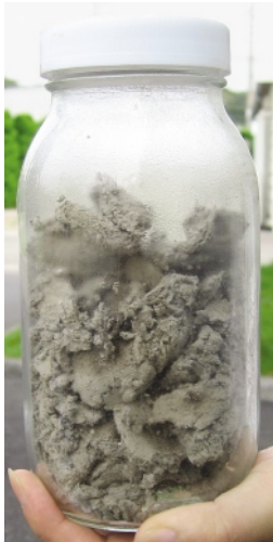
写真1（下）脱水後の下水汚泥 （臭い成分の除去により、灰色に脱色）

当研究所では、本技術を広く社会で活用することを目的に、これから活用が期待されている「下水汚泥」に着目し、下水道関係のプラントメーカーと共同で、当研究所・横須賀地区の小規模試作機（10ℓ/バッチ・表紙写真）により、DME脱水法の下水汚泥への適用を検討しました。実験では3.2kgの下水汚泥（含水率78%）に150ℓの液化DMEを90分かけて供給した結果、含水率30%にまで脱水できることを明らかにしました。またこの際、汚泥中の油脂も除去されるため、乾燥後の汚泥は灰色に脱色される（写真1）ことが明らかになりました。一方で、回収された含水DMEは濁り（写真2）、悪臭がひどく、当初の下水汚泥と含水DMEの性状を分析した結果、汚泥中の油脂が含水DMEに移行したことが原因であることが明らかになりました。このことから、下水汚泥を本方法で処理すれば、臭い成分を汚泥から分離可能であることがわかりました。