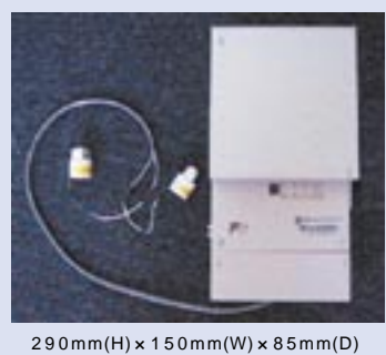
図1 非侵入型モニタリングシステム 需要家端末実用機