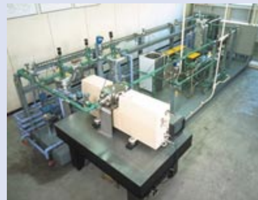
図2 超臨界CO 2 ヒートポンプ基礎実験装置(1996年設置)

改良が進んだ現在は、消費電力あたりの加熱能力を示すCOP(Coefficient of Performance)が4.9にまで向上している。すなわち、1の電気エネルギーから、実に4.9の熱エネルギーが得られ、熱効率では群を抜く。発電時までさかのぼってみると、電力は輸送や配電の損失を差し引けば、家庭には現在0.37が達成されているが、4.9のエコキュートを使用すれば、効率は1.81(4.9×0.37)となり、発電エネルギーを上回るエネルギーを作り出せる。即ち、電力会社から供給を受ける電力にヒートポンプを組み合わせることで、エネルギーの高効率使用が可能となる。大野氏は「エコキュートにより、電中研が社会に対して物で貢献できることを目に見える形で示すことができた。大きな励みとなる成果だ」と手応えを感じている。