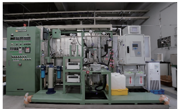
化学反応速度評価試験設備の外観

ヒドラジン代替剤の選定のために、代替候補剤の脱酸素性能に関する定量的な評価に取り組んでいます。